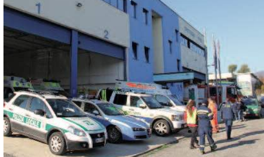
La sede del Gruppo di Protezione civile dei Volontari del Garda, a Cunettone.

A Salò è ancora vivo il ricordo del sisma del 24 novembre 2004. Sarà anche per questo che i salodiani dimostrano sempre grande solidarietà nei confronti delle popolazioni colpite da queste tremende calamità naturali, come il terremoto in centro Italia dell'agosto 2016. Non ha voluto essere da meno l'Amministrazione comunale, che ha deciso di devolvere al Comune di Amatrice dal sisma la somma di 30.000 euro. ●