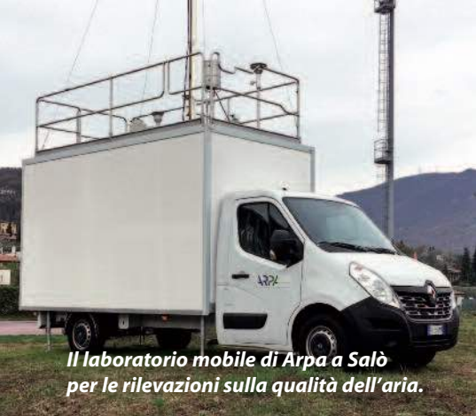
Il laboratorio mobile di Arpa a Salò per le rilevazioni sulla qualità dell'aria.