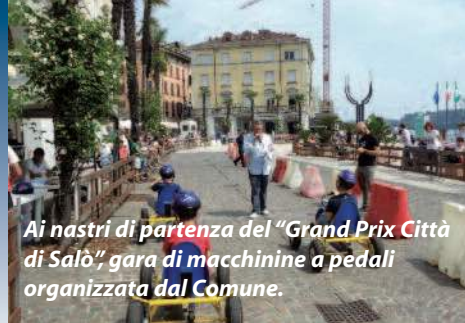
Ai nastri di partenza del "Grand Prix Città di Salò", gara di macchinine a pedali organizzata dal Comune.