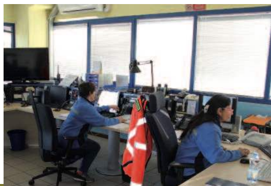
La sala operativa degli "Angeli azzurri", attiva h24.