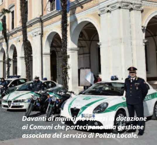
Davanti al municipio i mezzi in dotazione ai Comuni che partecipano alla gestione associata del servizio di Polizia Locale.

Polizia Locale di Salò conduce su disposizione dell'Amministrazione comunale operazioni mirate al contrasto del fenomeno dell'accattonaggio e dell'attività di parcheggiatore abusivo, fenomeni che grazie ai controlli risultano ancora contenuti.