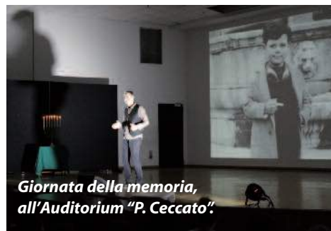
Giornata della memoria, all'Auditorium "P. Ceccato".