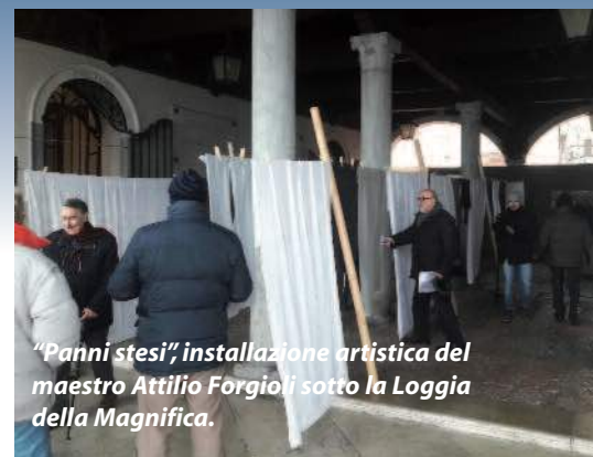
“Panni stesi”, installazione artistica del maestro Attilio Forgioli sotto la Loggia della Magnifica.

Il Comitato d'Onore del riconoscimento 100 Mete d'Italia è presieduto da Franco Frattini, già Ministro degli Esteri, oltre che Commissario Europeo, e comprende illustri personalità del mondo della politica, dell'arte e della cultura, tra cui il noto attore Carlo Verdone. ●