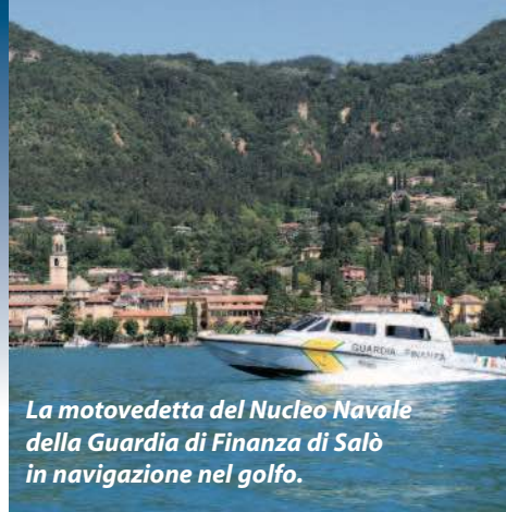
La motovedetta del Nucleo Navale della Guardia di Finanza di Salò in navigazione nel golfo.

San Felice del Benaco e Puegnago) situato in via Fermi, nell'area artigianale di Cunettone.