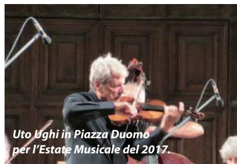
Uto Ughi in Piazza Duomo per l'Estate Musicale del 2017.

gi Comencini, celebre regista nato a Salò, e la sedicenne cinese Jingzhi Zhang, considerata un vero e proprio prodigio.