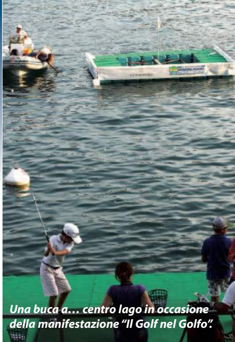
Una buca a... centro lago in occasione della manifestazione "Il Golf nel Golfo".