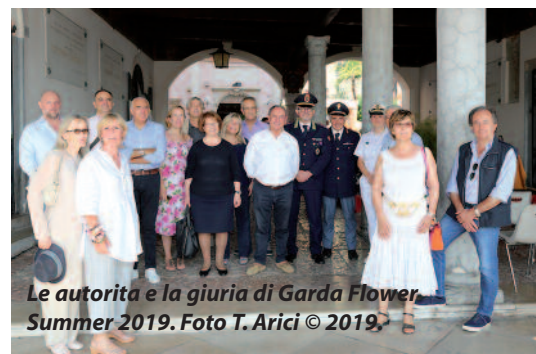
Le autorità e la giuria di Garda Flower Summer 2019.