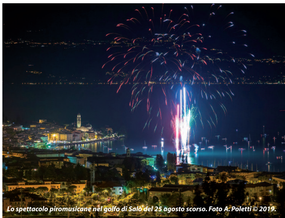
Lo spettacolo piromusicane nel golfo di Salò del 25 agosto scorso.

Altro spazio è ovviamente dedicato alle informazioni di servizio, con particolare attenzione alle prestazioni e ai servizi garantiti nei settori della pubblica istruzione e dei servizi sociali.