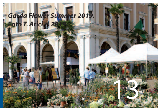
Garda Flower Summer 2019.