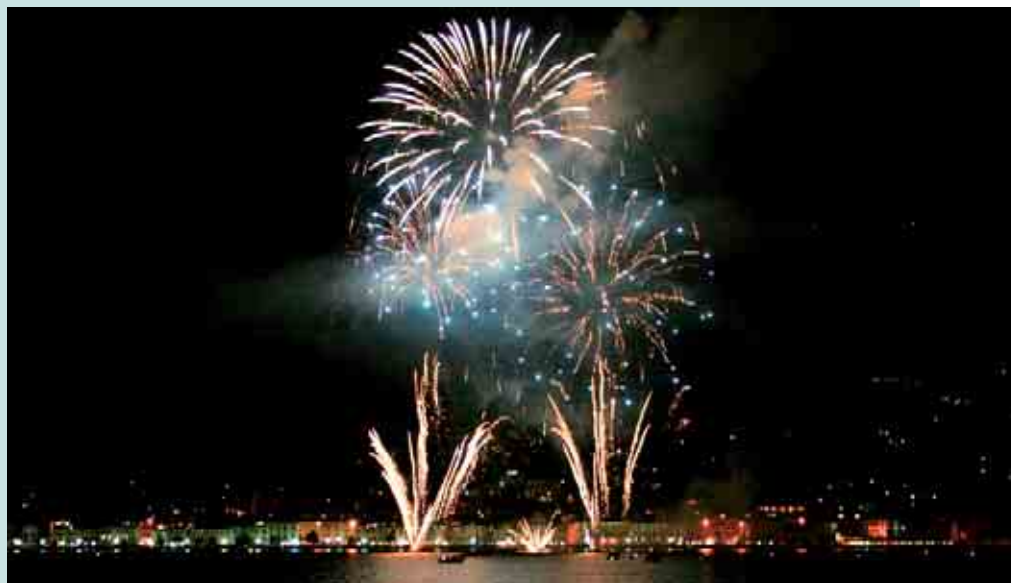
Fuochi d'artificio nel golfo di Salò per la chiusura della stagione estiva 2009.