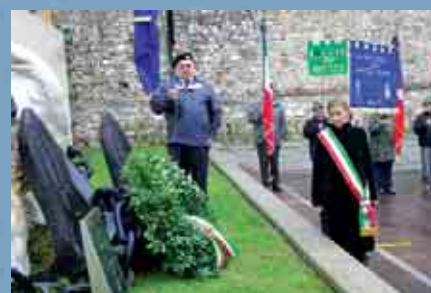
Cerimonia presso il monumento ai Caduti del mare in piazza della Boden Powell.