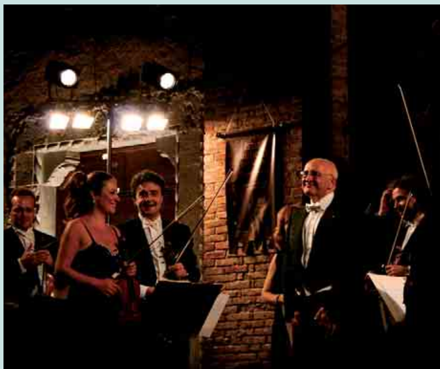
Salvatore Accardo sul palcoscenico di Piazza Duomo per l'Estate Musicale 2009.