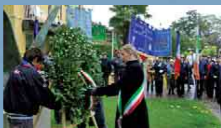
Cerimonia presso il monumento ai Caduti dell'Aeronautica in largo G. D'Annunzio.