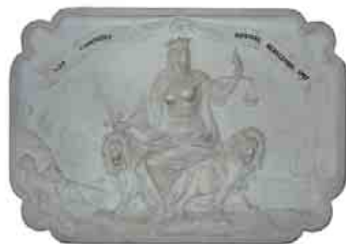
Bassorilievo della stele col busto di Girolamo Fontoni all'ingresso del municipio: raffigura una donna con bilancia e spada assisa tra due leoni, rappresentate la comunità della riviera bresciana.

La nostra città si pone ai vertici della classifica nazionale sulla qualità della vita che si misura col Bil, il "benessere interno lordo" che vuol dire sicurezza, ambiente e patrimonio sociale e culturale, ma non solo.