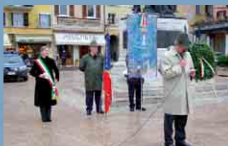
Cerimonia presso il monumento ai Caduti di tutte le guerre in piazza della Vittoria.