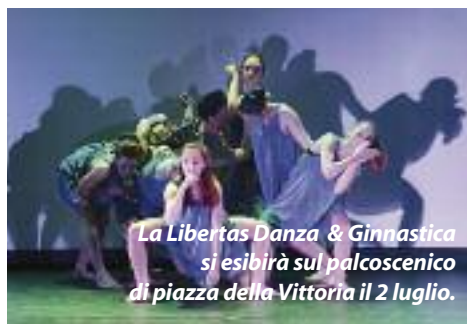
La Libertas Danza & Ginnastica si esibirà sul palcoscenico di piazza della Vittoria il 2 luglio.