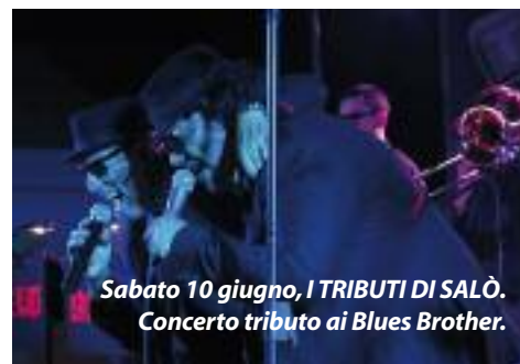
Sabato 10 giugno, I TRIBUTI DI SALÒ. Concerto tributo ai Blues Brother.