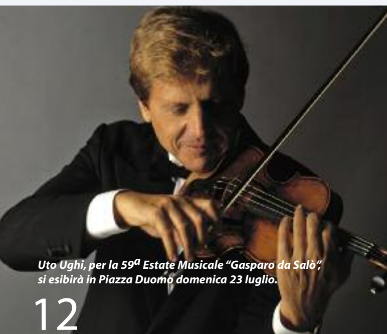
Uto Ughi, per la 59ª Estate Musicale "Gasparo da Salò", si esibirà in Piazza Duomo domenica 23 luglio.

Regia Claude Barras, 2016 (ingresso gratuito)