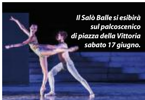
Il Salò Ballet si esibirà sul palcoscenico di piazza della Vittoria sabato 17 giugno.