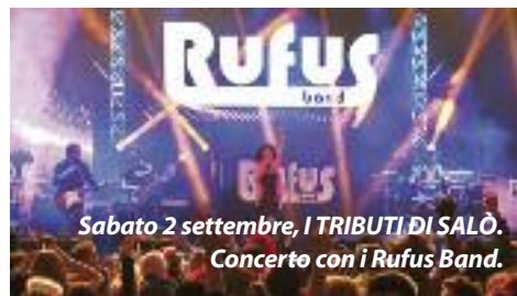
Sabato 2 settembre, I TRIBUTI DI SALÒ. Concerto con i Rufus Band.