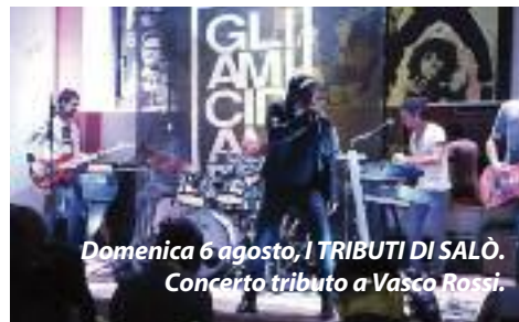
Domenica 6 agosto, I TRIBUTI DI SALÒ. Concerto tributo a Vasco Rossi.