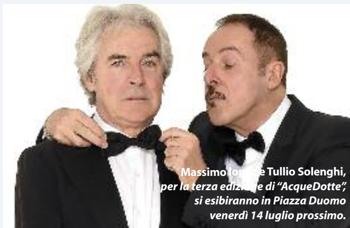
Massimo Iorizzo e Tullio Solenghi, per la terza edizione di "AcqueDotte", si esibiranno in Piazza Duomo venerdì 14 luglio prossimo.

Giovedì 8 giugno - ore 21.00 Sala dei Provveditori, Palazzo Municipale IL FORMAGGIO CON LE PERE. La storia di un proverbio Spettacolo proposto da Maurizio Lovisetti A cura della Ass.ne Amici della Musica