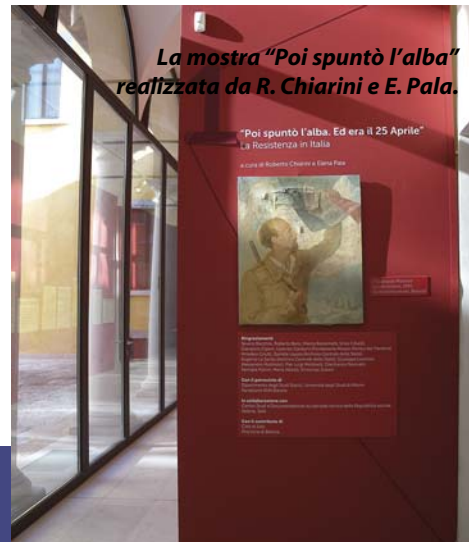
La mostra "Poi spuntò l'alba" realizzata da R. Chiarini e E. Pala.