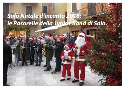
Salò Natale d'incanto 2016: le Pasorelle della Junior Band di Salò.

come al residente, una moltitudine di informazioni. Si tratta di un'applicazione per cellulari smartphone e tablet, scaricabile da chiunque gratuitamente tramite l'app store di Apple o il play store dei dispositivi Android.