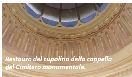
Restauro del cupolino della cappella del Cimitero monumentale.

Sono in corso lavori e valutazioni anche in merito ad alcune problematiche strutturali. In seguito alla fessurazione di 3 travi portanti del solaio tra il piano interrato ed il piano terra delle gallerie, il Comune, con il supporto di tecnici ingegneri, ha provveduto a realizzare una messa in sicurezza temporanea della struttura e proceduto con uno studio strutturale approfondito per poter giungere ad una soluzione costruttiva di sostegno e non deturpativa dell'ambiente sacro. Tali indagini hanno portato a considerare la possibilità di realizzare una struttura reticolare in acciaio in appoggio all'edificio e di supporto dello stesso. Soluzione già valutata con la Soprintendenza che troverà presto attuazione. Si è inoltre provveduto a sistemare l'impianto elettrico dell'ala ovest, che presentava problemi