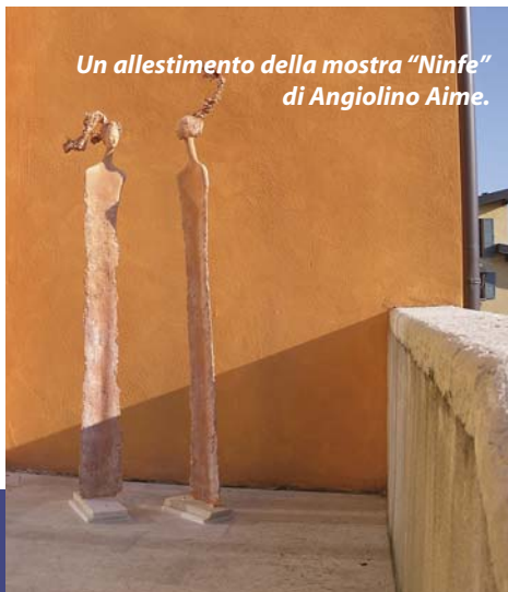
Un allestimento della mostra "Ninfe" di Angiolino Aime.