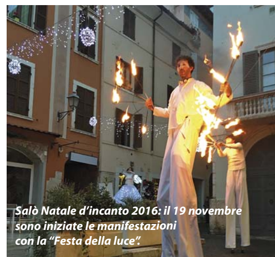
Salò Natale d'incanto 2016: il 19 novembre sono iniziate le manifestazioni con la "Festa della luce".