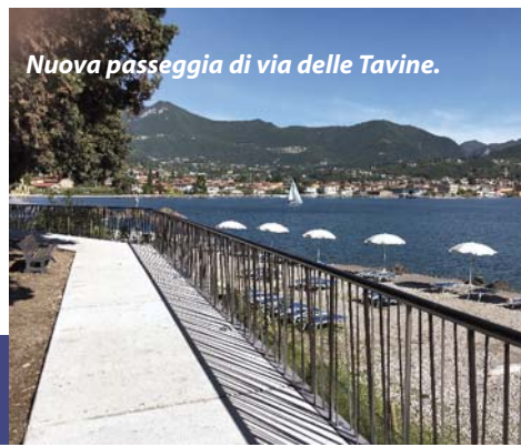
Nuova passeggiata di via delle Tavine.