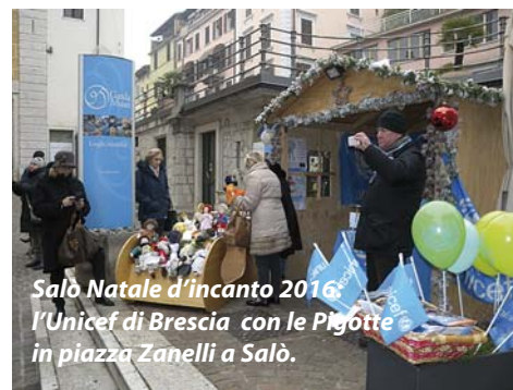
Salò Natale d'incanto 2016: l'Unicef di Brescia con le Pigotte in piazza Zanelli a Salò.

La app del circuito iTown è uno strumento già in dotazione a numerosi comuni gardesani che consente di rendere facilmente fruibili, al turista