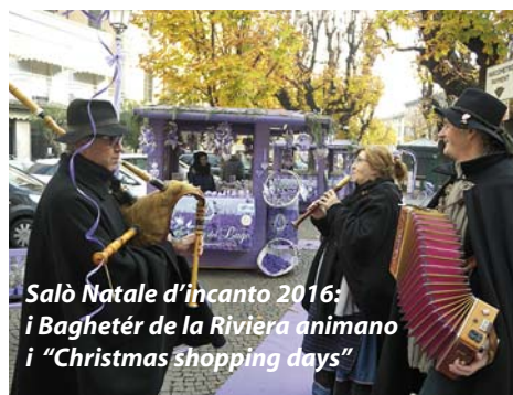
Salò Natale d'incanto 2016: i Baghetèr de la Riviera animano i "Christmas shopping days"

Shopping day serale, invece, con i negozi aper-