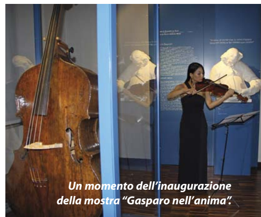
Un momento dell'inaugurazione della mostra "Gasparo nell'anima".