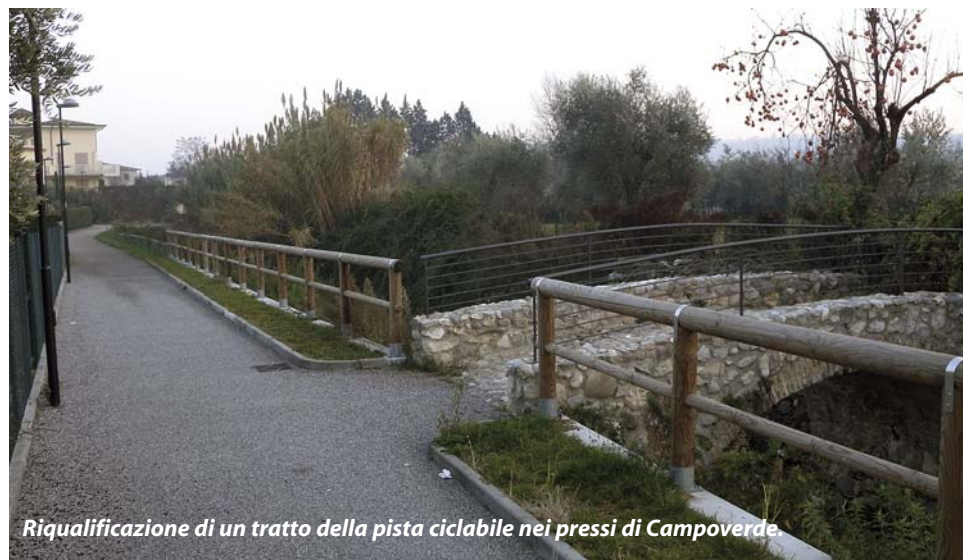
Riqualificazione di un tratto della pista ciclabile nei pressi di Campoverde.

Realizzato a Campoverde il tratto di ciclabile di collegamento con il percorso dell'Alto Garda "Salò - Limone" e con le ciclabili della Valtenesi. Un breve tratto tra via de Gasperi e via S. Firmina, della lunghezza di 70 metri, ma fondamentale in quanto raccordo tra piste esistenti, che garantiscono la mobilità su due ruote tra i centri rivieraschi. L'intervento ha comportato anche l'esecuzione di opere di sistemazione del versante del torrente S. Anna a sostegno della ciclabile. Sistemato il ponte romano, reso fruibile da tutti. Finanziamento regionale; importo lavori 120mila euro; lavori iniziati a dicembre 2014 e conclusi ad aprile 2015. ●