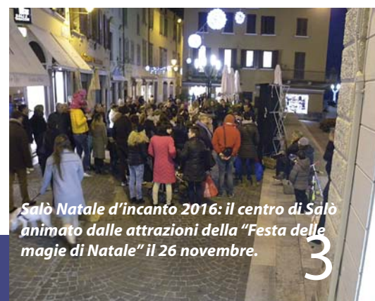
Salò Natale d'incanto 2016: il centro di Salò animato dalle attrazioni della "Festa delle magie di Natale" il 26 novembre.