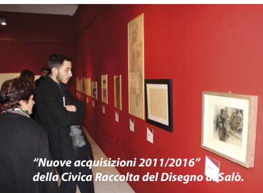
"Nuove acquisizioni 2011/2016" della Civica Raccolta del Disegno di Salò.

Orari: dal martedì alla domenica 10/18. Biglietto unico (visita al MuSa con le collezioni permanenti, al Museo del Nastro Azzuro, alla mostra Il culto del duce e alla quattro nuove esposizioni): intero 8 euro; ridotto 5 euro (studenti in comitiva, ragazzi dai 7 ai 18 anni, over 65, tessere convenzionate, comitive adulti di almeno 35 persone, cittadini salodiani residenti); gratis bambini fino a 6 anni, il capogruppo, gli insegnanti (1 ogni 15 studenti). ●