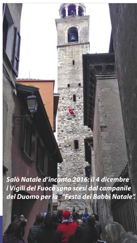
Salò Natale d'incanto 2016: il 4 dicembre i Vigili del Fuoco sono scesi dal campanile del Duomo per la "Festa dei Babbi Natale".