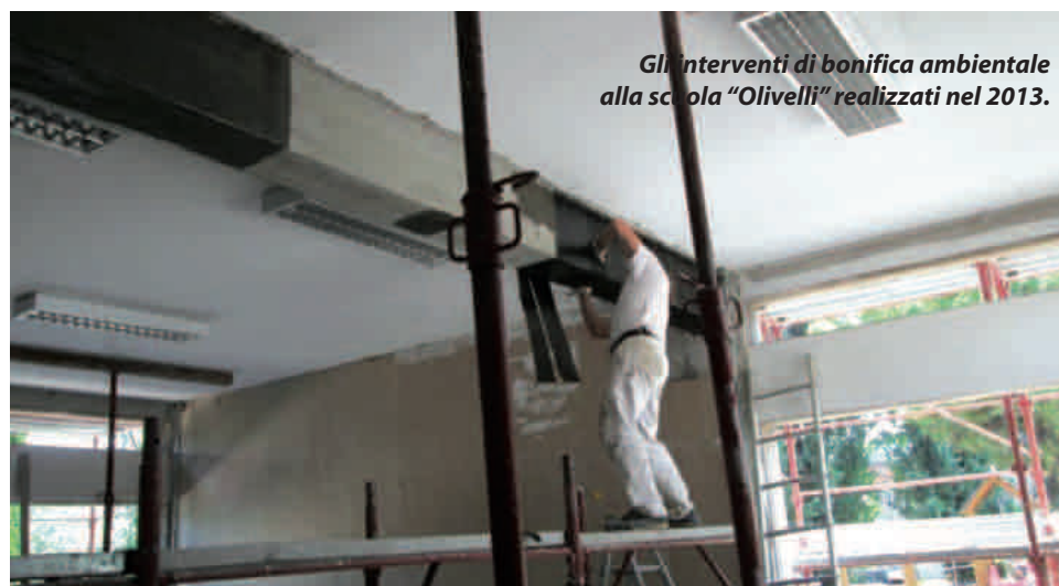
Gli interventi di bonifica ambientale alla scuola "Olivelli" realizzati nel 2013.

Questo ogni giorno, alle 8 e poi di nuovo alle 13. Una situazione già denunciata da genitori e autisti del pullman di cui il Comune si è fatto carico, coinvolgendo la Provincia di Brescia, titolare della Sp572. Il semaforo sarà collocato nei pressi della fermata dei pullman, di fronte alla chiesa di Campoverde, e sarà sempre lampeggiante. Agli autisti dei pullman di linea sarà fornito un telecomando tramite il quale potranno far scattare il rosso, in modo da consentire loro di effettuare manovra in sicurezza. Il costo dell'impianto, circa 35mila euro, sarà sostenuto dall'Amministrazione comunale. ●