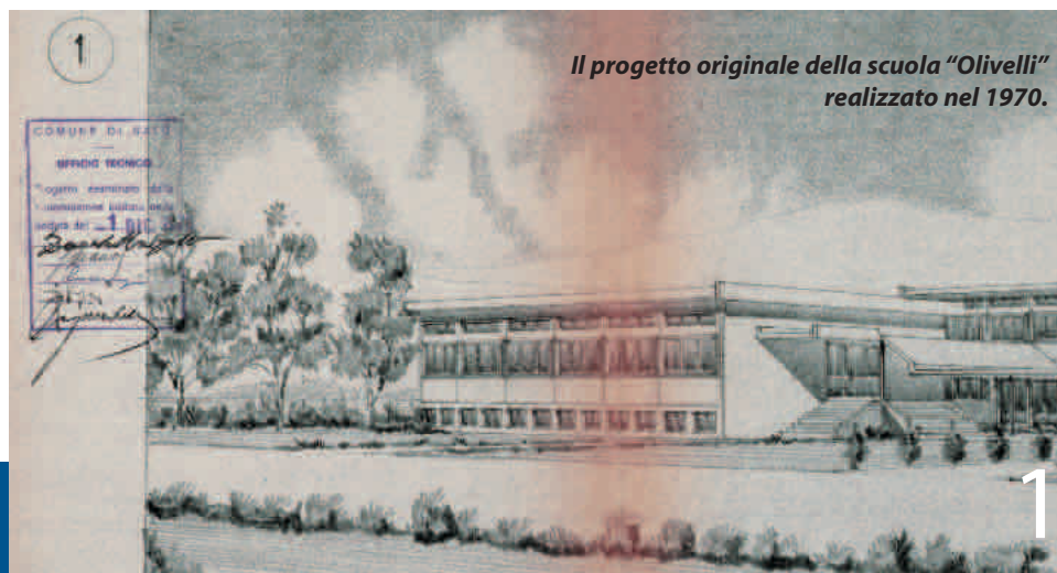
Il progetto originale della scuola "Olivelli" realizzato nel 1970.

Le scuole salodiane sono un luogo sicuro e protetto, al quale possiamo affidare in tutta tranquillità i nostri figli. ●