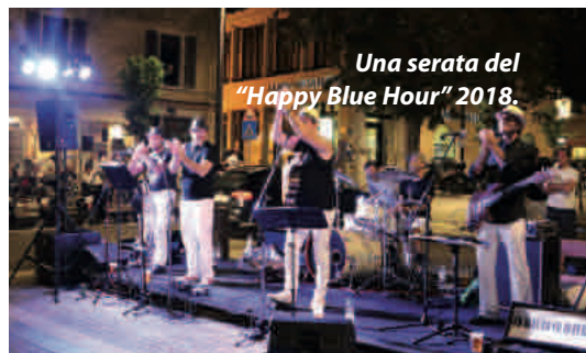
Una serata del "Happy Blue Hour" 2018.