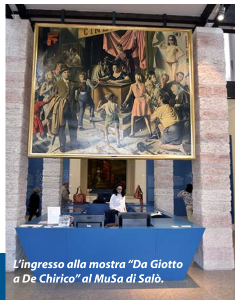
L'ingresso alla mostra "Da Giotto a De Chirico" al MuSa di Salò.