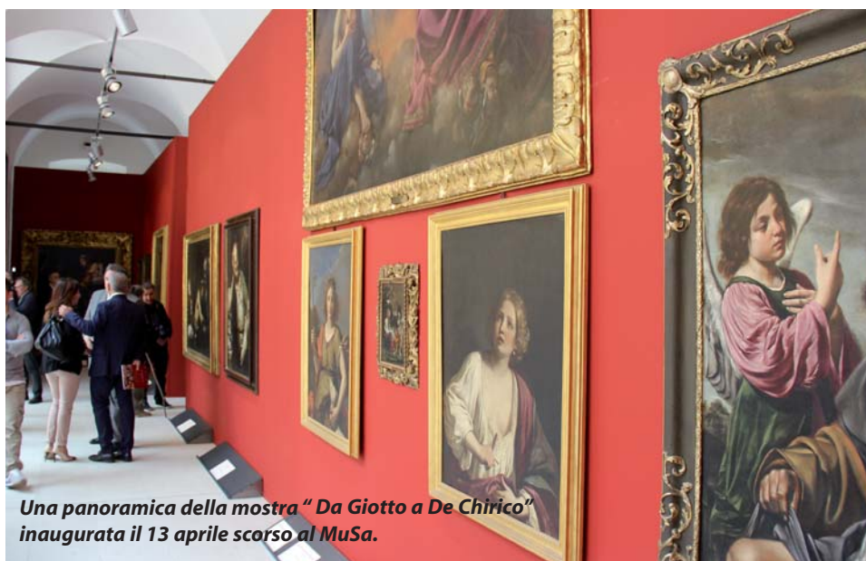
Una panoramica della mostra "Da Giotto a De Chirico" inaugurata il 13 aprile scorso al MuSa.