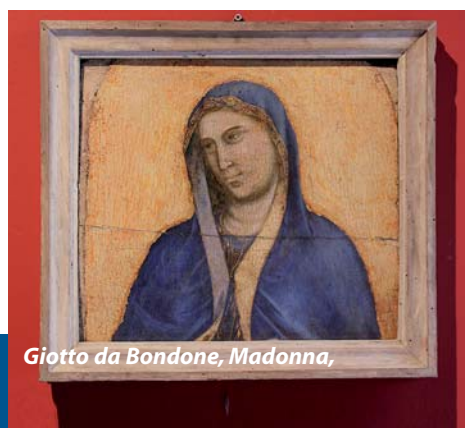
Giotto da Bondone, Madonna,