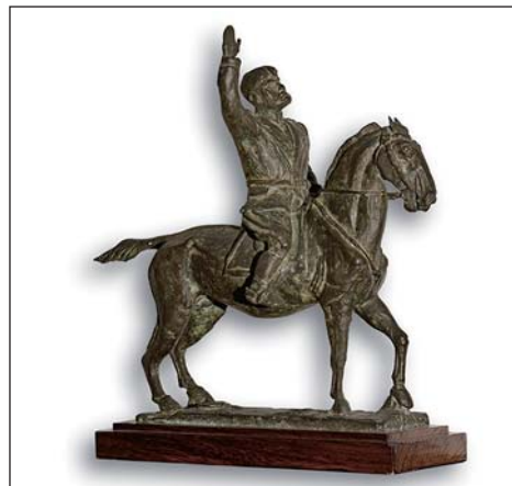
Antonio Ligabue (1899-1965), «Ritratto equestre del Duce».

MUSA: grandi eventi «Da Giotto a De Chirico»