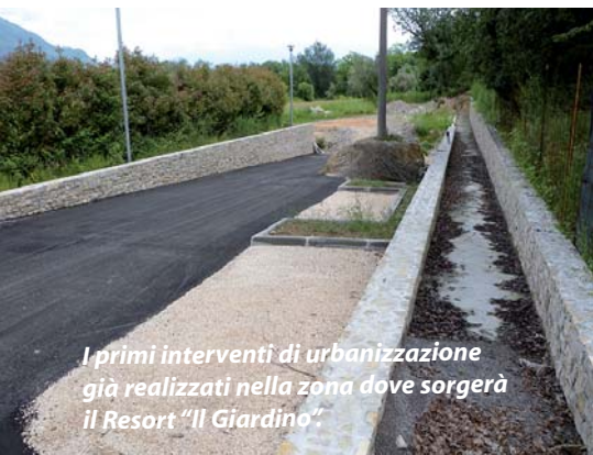
I primi interventi di urbanizzazione già realizzati nella zona dove sorgerà il Resort "Il Giardino".

Le preoccupazioni circolate nei mesi scorsi per i ritardi dell'intervento, con qualcuno che già dava per naufragata l'operazione, sono rientrate. La proprietà ha annunciato di essere pronta a dare il via ai lavori. L'iter di approvazione è di fatto concluso da tempo. In realtà resta ancora un ultimo scoglio da superare, legato alla nuova normativa di calcolo dei cementi armati, la cui competenza è ora passata dalla Regione ai Comuni. Ma si tratta di una questione che potrà essere risolta nel giro di qualche settimana. Inutile dire che ci si augura che il nuovo resort (un 5 stelle con 97 suite, 2000 mq di area wellness con piscina interna ed esterna, aperto tutto l'anno e con 80-100 dipendenti) possa portare nuova linfa al turismo salodiano. Di certo