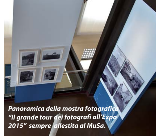
Panoramica della mostra fotografica "Il grande tour dei fotografi all'Expo 2015" sempre allestita al MuSa.

La prima allinea opere di dieci artisti, variamen-