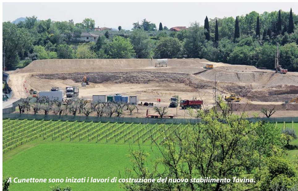
A Cunettone sono iniziati i lavori di costruzione del nuovo stabilimento Tavina.

Concluso l'iter progettuale e autorizzativo per la riqualificazione del tratto di lungolago «D'Annunzio» compreso tra il porticciolo di Gardone e il Rimbalzello, in parte ricadente sul territorio salodiano. «Siamo in attesa - spiegano all'Autorità di Bacino - del finanziamento regionale. Possiamo supporre di iniziare i lavori in autunno». Andrà rifatto l'arredo e, soprattutto, verificata la parte strutturale della banchina. Il costo dell'intervento ammonta a 400mila euro (200mila finanziati da Regione Lombardia; 59.500 da Autorità di Bacino, 70.250 a carico di ognuno dei due Comuni). ●