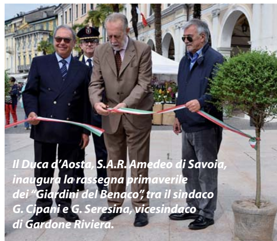
Il Duca d'Aosta, S.A.R. Amedeo di Savoia, inaugura la rassegna primaverile dei "Giardini del Benaco" tra il sindaco G. Cipani e G. Seresina, vicesindaco di Gardone Riviera.

Anche l'indicatore del debito per abitante, dunque, risulta ovviamente in netta riduzione. Ovviamente è evidente che il bilancio raggiunge gli obiettivi prefissati e rispetta il patto di stabilità 2015. ●